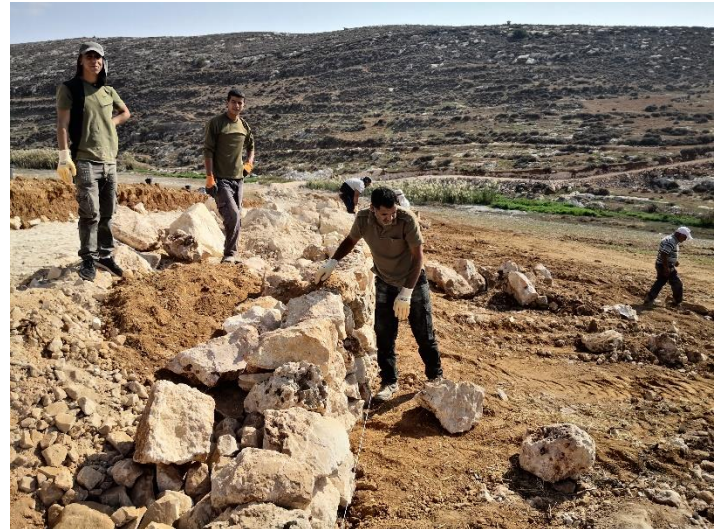
صورة: تشغيل العمال العاطلين عن العمل بسبب جائحة كورونا في الأعمال الزراعية

عمل المشروع على توفير فرص تشغيل لـ 225 عامل عاطل عن العمل وتضرر من انتشار فيروس كورونا في مجال تأهيل الأراضي الزراعية والطرق الزراعية وبناء السلاسل الحجرية في مناطق "ج"، وعمل المشروع على توزيع 500 سلة غذائية المكونة من منتجات الجمعيات التعاونية الزراعية على الأسر الأكثر فقراً والتي اصيبت أحد افرادها بفيروس كورونا، بالإضافة الى تطوير آلية التعبئة والتغليف وتعبئة وتغليف 4 طن من منتجات الجمعيات والتعاونيات الزراعيات المستهدفة لـ 10 جمعيات.