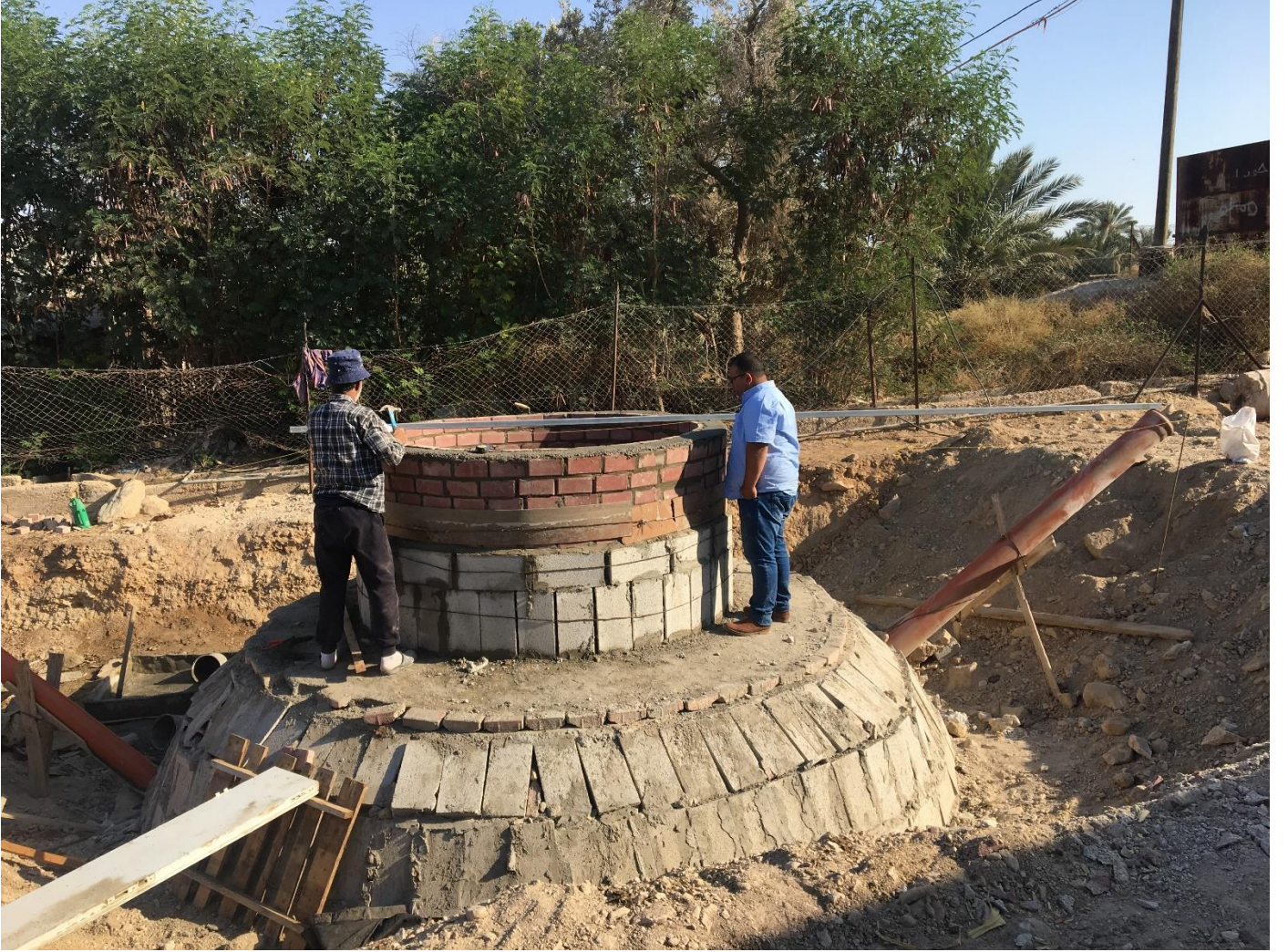
صور توضيحية لنموذج الهاضم الحيوي

وهذا النشاط تم اختباره في بيئة مفتوحة فهي أول مزرعة تستخدم نظام الهضم الحيوي في فلسطين لإنتاج واستخدام الأسمدة السائلة. المستفيدون 41 مزارعاً 73% منهم من الشباب.