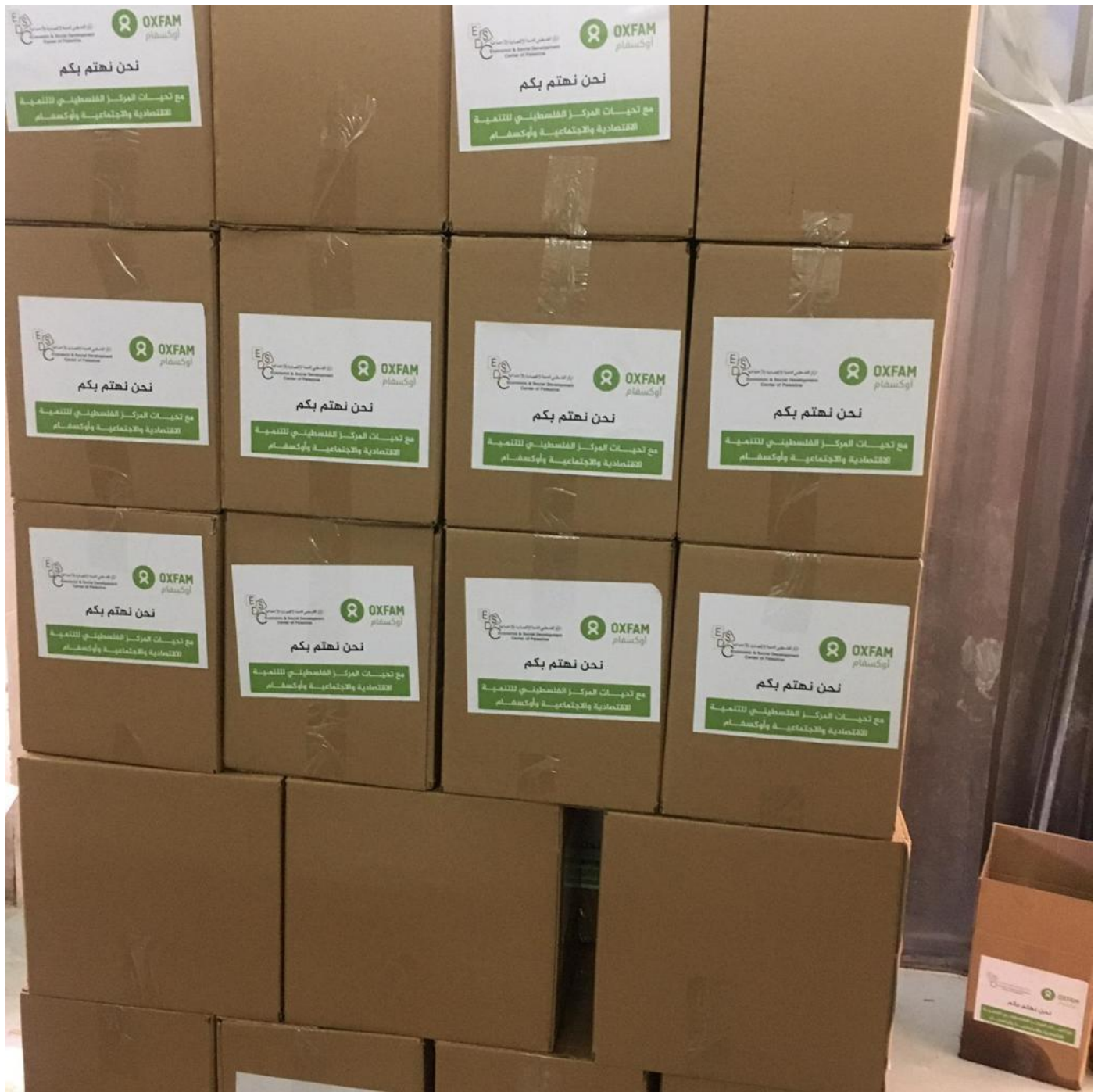
توزيع مواد صحية لمواجهة فيروس كورونا