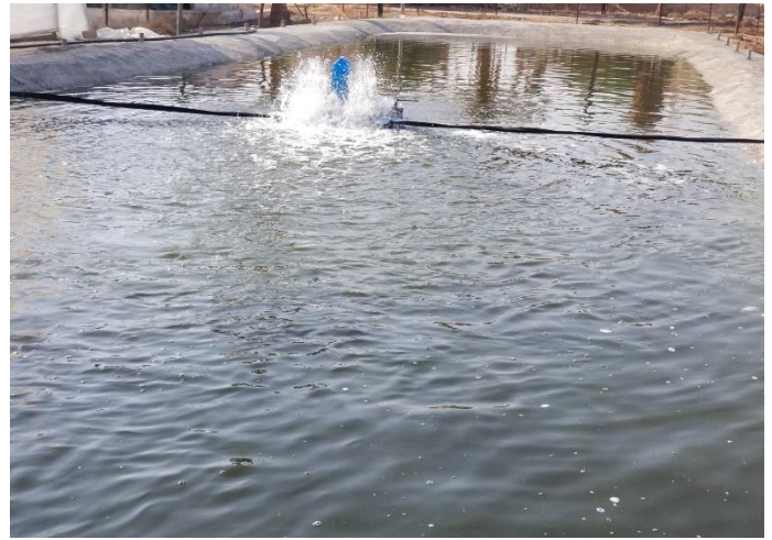
تطوير وتجهيز البركة الرئيسية (نظام مفرخة أسماك)