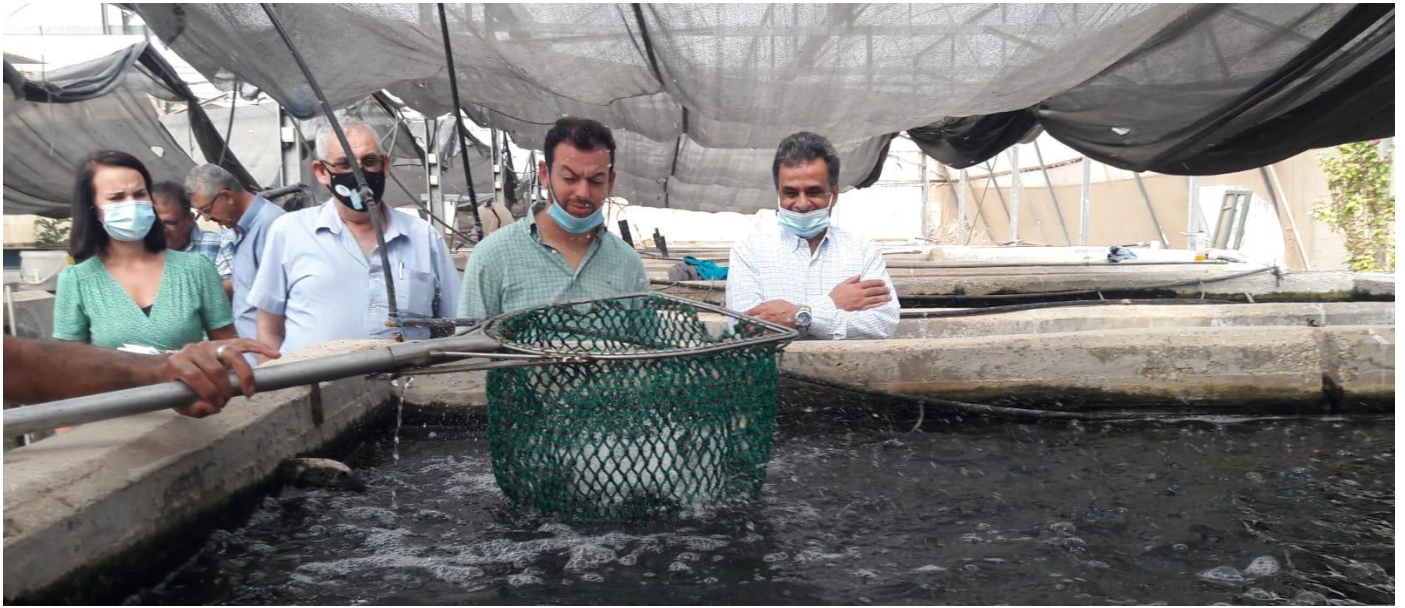
دعم مزارعي الاسماك في اريحا بتوفير فراخ سمك المشط

وساهم المشروع في تحسين فرص تسويق المنتجات الزراعية المصنعة من قبل الجمعيات والتعاونيات الزراعية في السوق المحلي والأسواق الخارجية من خلال تحسين البنية التحتية التسويقية وأنظمة التعبئة والتغليف لـ 25 جمعية تعاونية تضم في عضويتها 802 عضو (172 ذكور و630 اناث). وعمل المشروع على دعم مجموعة نسوية متخصصة في إنتاج الحويرنة في محافظة اريحا التي توظف 10 عمال موزعين على 3 ذكور و7 نساء. وكما عمل المشروع على تركيب أنظمة طاقة شمسية للجمعيات والتعاونيات الزراعية من أجل تقليل تكاليف الإنتاج. حيث تم تركيب نظام طاقة شمسية بقدرة 10.8 كيلو وات لتعاونية سيدات بزانيا التي توظف 112 امرأة في إنتاج العسل. ونظام طاقة شمسية بقدرة 15 كيلو وات لتعاونية طوباس النسائية التي تدير مطبخًا نسائيًا وسوبر ماركت يربط المزارعين من جميع أنحاء محافظة طوباس بالمستهلكين، ويعمل بها حاليًا 149 امرأة. و25 كيلو وات لمصنع البان النعجة الذهبية، الذي يضم في عضويته 80 مزارع ومربي اغنام في محافظة طوباس. وعمل المشروع على تركيب مضخات شمسية متنقلة خفيفة الوزن وذات كفاءة عالية لـ 10 مستفيدين، وساهم المشروع في تقليل مخاطر انتشار فيروس كورونا على المزارعين وتعزيز صمودهم من خلال توفير خزانات للمياه بسعة 5 كوب والقمح والشعير لـ 50 مزارع في منطقة وادي الأردن، حيث بلغ مجموع ما تم توزيعه من القمح والشعير بـ 30 طن، 20 طن على التوالي.