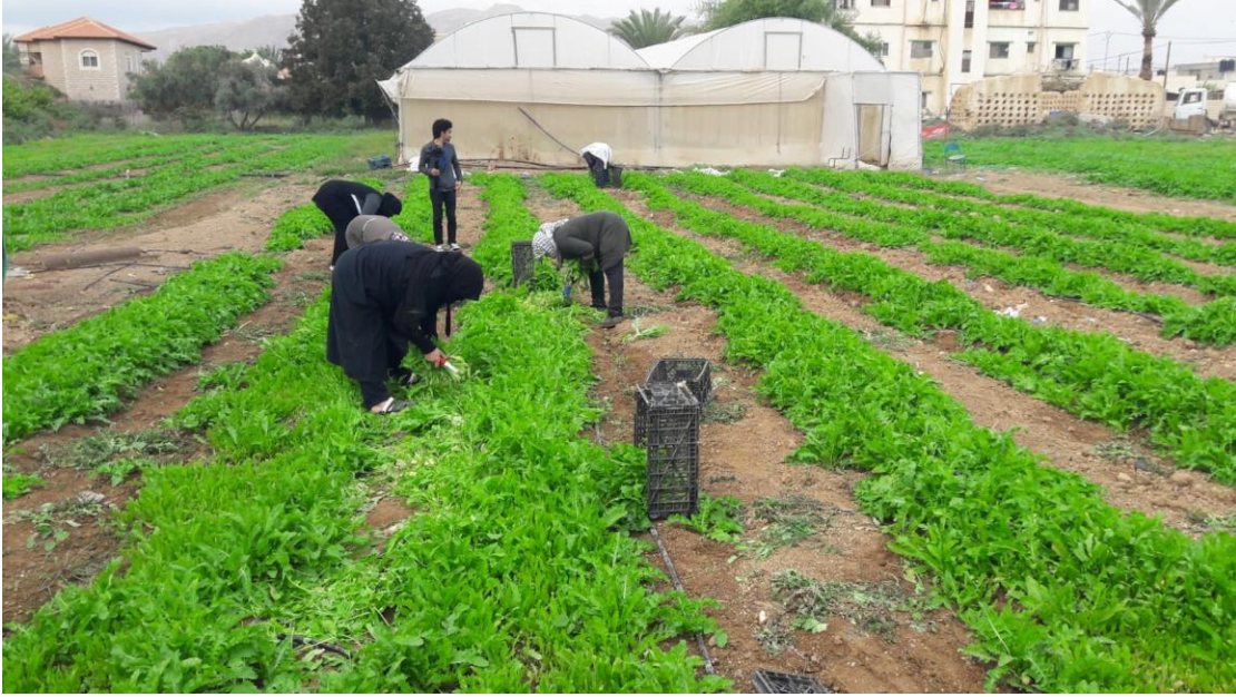
صورة: مشروع لانتاج الحويرنه في مدينة أريحا.

مجموعات التوفير والتسليف، وتوفير منح لمشاريع صغيرة لـ 80 مستفيدة. وكما عمل المشروع على تنظيم جلسات توزيع مدخرات مجموعات التوفير بقيمة 1,357,000 شيكل، تم توزيعه على 505 عضوة. وقام طاقم المشروع على توزيع أدوات السلامة العامة في ظل جائحة فيروس كورونا لـ 18 مجموعة من مجموعات التوفير والتسليف، واستفاد من هذا النشاط 500 عضوة.