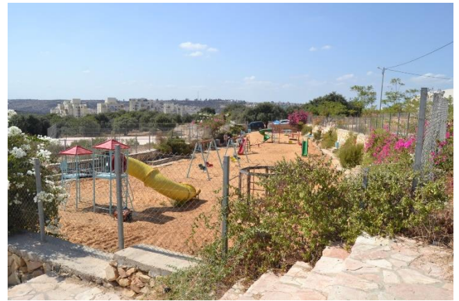
تأهيل حديقة ومنتزه أبو ليمون العامة في قرية بلعين