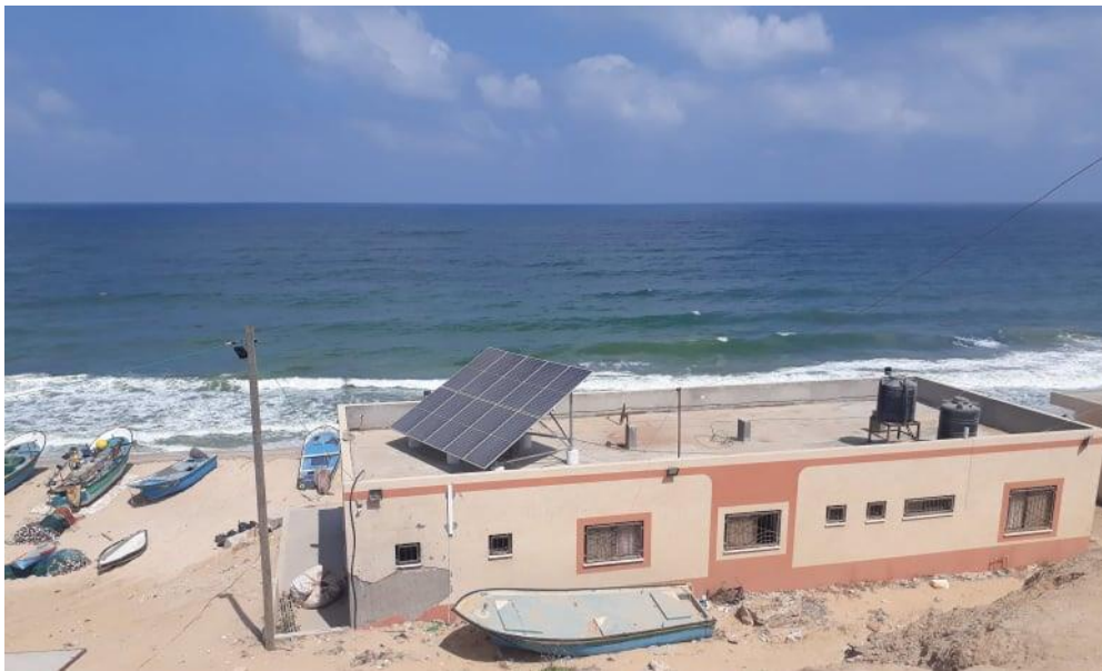
صورة توضح الخلايا الشمسية بقدرة 63 كيلو واط المستخدمة لتشغيل ماكينة انتاج الثلج في دير البلح

قام المركز خلال المشروع العمل على تعزيز القدرات الادارية والمالية وتطوير النظام الاداري والمالي لـ 10 مستفيدين من اعضاء وموظفي نقابة الصيادين، بالإضافة الى توريد وتركيب نظام طاقة شمسية وماكينة انتاج الثلج المبشور مع غرفة تخزين وملحقاتها بقدرة 6 طن/24 ساعة التي استفاد منها 670 من أعضاء وموظفي نقابة الصيادين. وتدريب 20 سيدة من أفراد عائلات الصيادين على بناء القدرات.