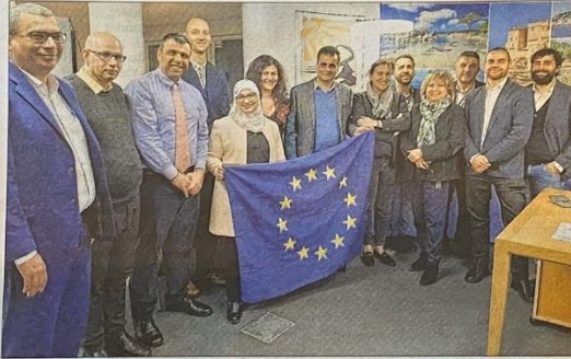
Tunisie, Liban, Italie, Palestine et Corse, partenaires du projet européen Interreg "Fishmednet" en faveur de la promotion, de la diversification et du développement du secteur de la pêche.

Doté d'un budget de 2,2 millions d'euros, il a vocation, outre les échanges d'expériences et de savoir-faire entre les partenaires, à mettre en œuvre des actions de formation des entreprises et professionnels de la pêche pour accroître leur potentiel de diversification et d'intégration et à favoriser le développement de nouveaux services, labels et produits afin