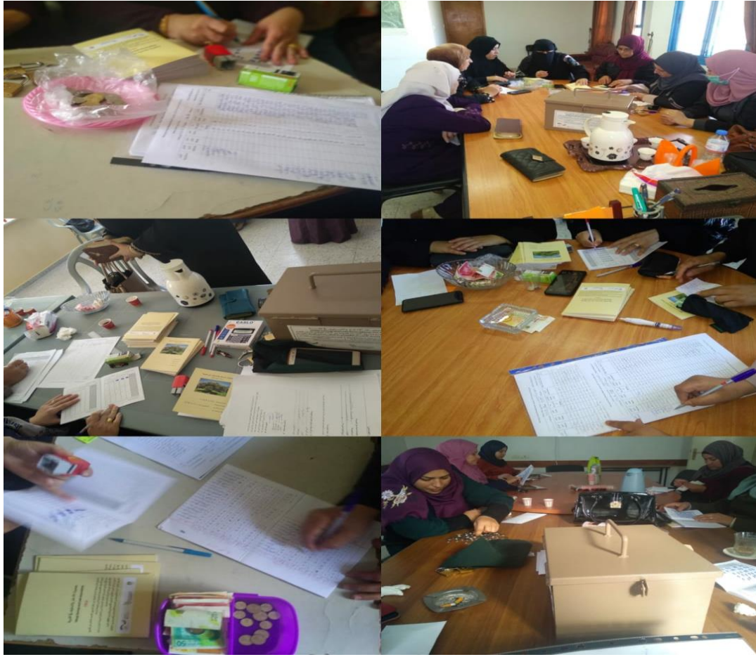
جلسات تعريفية وتدريبية خاصة بمجموعات التوفير