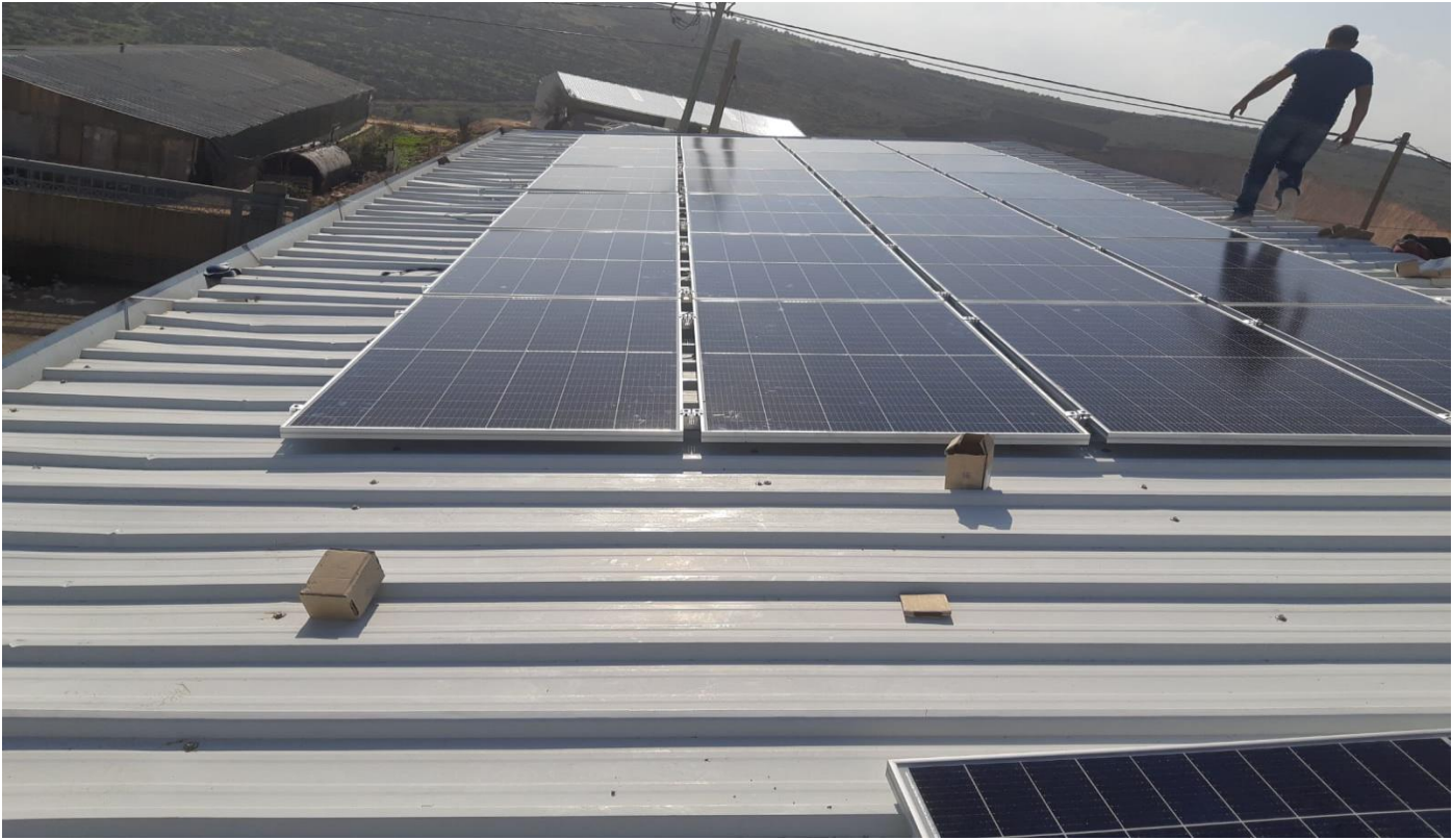
نظام الطاقة الشمسية

من خلال تركيب أنظمة الطاقة الشمسية المتنقلة والصديقة للبيئة استهدف هذا النشاط ثلاث تعاونيات مع إجمالي عدد أفرادها 341 مستفيد، الذي يهدف الى تقليل تكلفة التشغيل/ الإنتاج ، من خلالها استهدف هذا النشاط تعاونية بزاريا النسائية التي توظف 112 امرأة في إنتاج العسل بنظام طاقة شمسية بقدرة 10.8 كيلو واط، وتعاونية طوباس النسائية التي تدير مطبخاً نسائياً ينتج جميع أنواع المعجنات الفلسطينية وسوبر ماركت يربط المزارعين من جميع انحاء منطقة طوباس بالمستهلكين ويعمل بها حالياً 149 امرأة بنظام طاقة شمسية بقدرة 15 كيلو واط، ومصنع ألبان الأغنام والماعز الوحيد في فلسطين والذي يدعم 80 مزارعاً/راعياً بقدرة 25 كيلو واط.