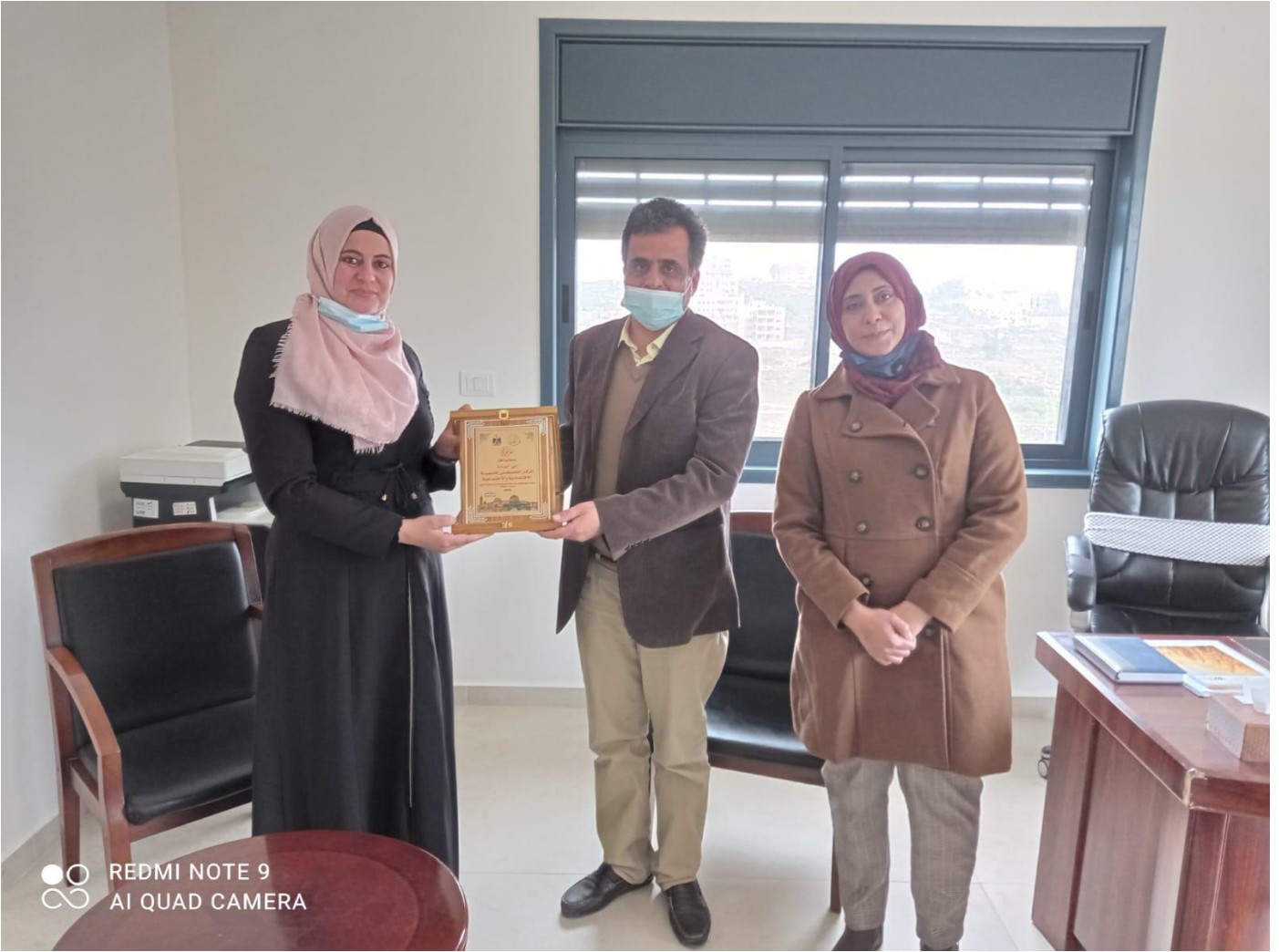
تقدير جهود المركز من الجمعيات والبلديات ووزارة الزراعة